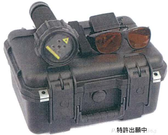
P 特許出願中 ing